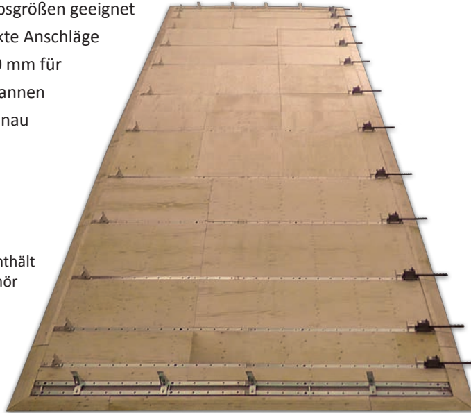
Abbildung enthält Sonderzubehör