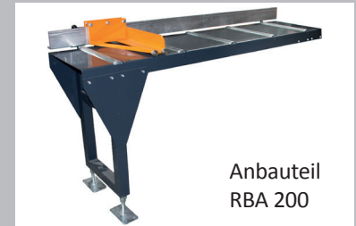
Anbauteil RBA 200